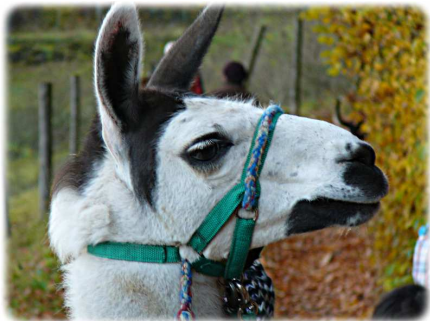
Ausflug in ein Lama-Gehege einschließlich Wanderung mit den Lamas

Weitere Informationen und die aktuellen Termine unseres Vierteljahresprogramms finden Sie auch im Internet: www.caritas-erlangen.de .